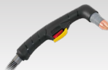
Ръчна горелка MT-70 70 А (50%) 6 m - 037502 12 m - 037519