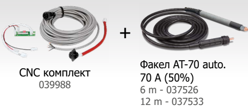
CNC комплект 039988