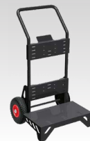
Ръчна количка 039568