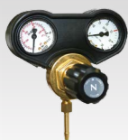
Регулатор 30 л/мин 041622 041219 041646