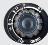
Odstín 5 > 13 a režim broušení