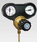
Regulátor 30 l/min