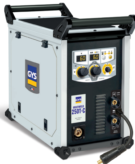
ohne Zubehör geliefert (014572)