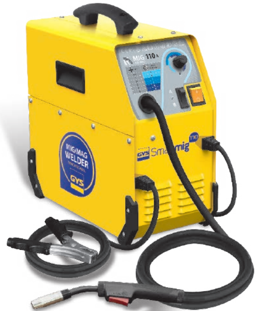
Lieferumfang: Massekabel und festmontierter Brenner 2,2 m.