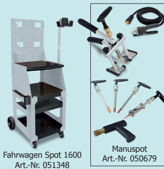
Fahrgewagen Spot 1600 Art.-Nr. 051348