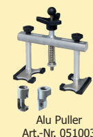
Alu Puller Art.-Nr. 051003