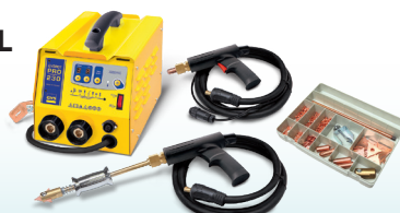
SPEEDLINER PRO 230 - Art.-Nr. 036017 SPEEDLINER PRO 400 - Art.-Nr. 036024