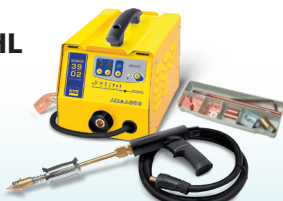
SPEEDLINER 39.02 - Art.-Nr. 035010 SPEEDLINER 39.04 - Art.-Nr. 035027