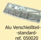
Alu Verschleißteil-Box -standard- ref. 050020