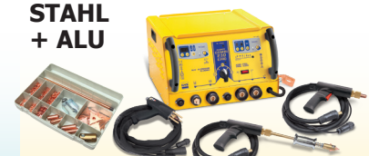
SPEEDLINER Combi 230 E PRO - Art.-Nr. 036062