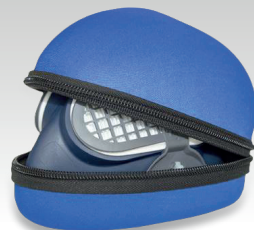
Tasche für Maske 037045