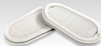
2 Austauschfilter FFP3 037038