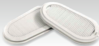
2 Austauschfilter FFP3 037038