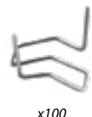
Klammern Typ M Riss von d. Aussenseite Art.-Nr. 047952