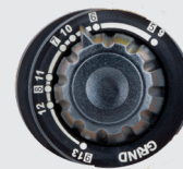
Tinte 5>13 y modo pulido