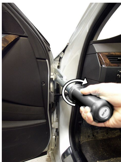
② Apretar simplemente girando el mango