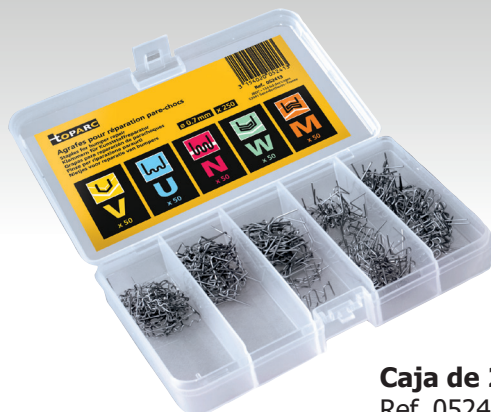
Caja de 250 grapas Ref. 052413