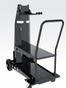
Carro ref. 041257