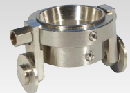
Käru tõrviku TPT 40 jaoks 040199