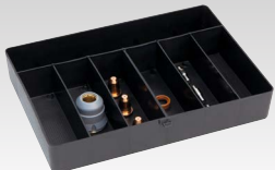
Tarbekaupade karp tõrviku TPT 40 45 A jaoks - 039957