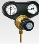
Säädin 30L/min 041622 041219 041646