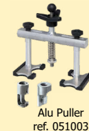
Alu Puller ref. 051003