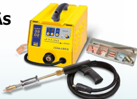
SPEEDLINER 39.02 - ref. 035010 SPEEDLINER 39.04 - ref. 035027