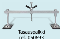
Tasauspalkki ref. 050693