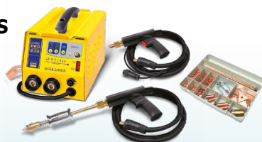
SPEEDLINER PRO 230 - ref. 036017 SPEEDLINER PRO 400 - ref. 036024