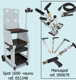
Spot 1600 -vaunu ref. 051348