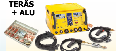
SPEEDLINER Combi 230 E PRO - ref. 036062