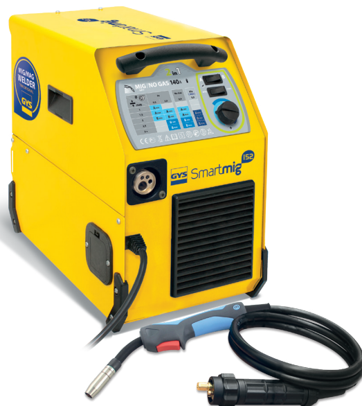
Livré avec câble de masse et torche EURO 2 m

Son ventilateur à débit constant le protège des surchauffes.