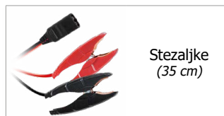
Stezaljke (35 cm)