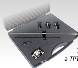
Írányító készlet a TPT 40-es zseblámpához 040205