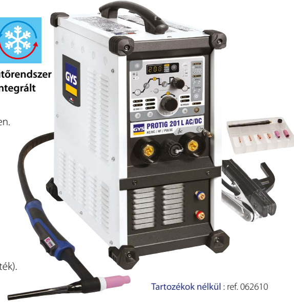
Tartozékok nélkül : ref. 062610