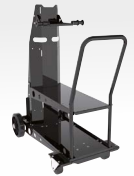
Kocsi ref. 041257