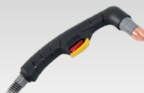
Torcia MT-70 manuale 70 A (50%) 6 m - 037502 12 m - 037519