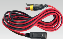
Prolunga 2.5 m - 029057