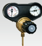
Manometro 30L/min 🇫🇷 041622 🇩🇪 041219 🇬🇧 041646