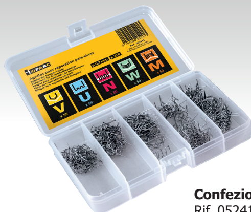
Confezione 250 graffette Rif. 052413