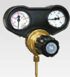
Regulatorius 30 l/min 041622 041219 041646