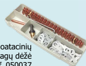
Plieninė eksploatacinių medžiagų dėžė ref. 050037