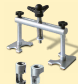
Alu plėstuvai ref. 051003