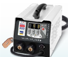
PROLINER PRO 230 - nuoroda. 035799 PROLINER PRO 400 - Nr. 035805