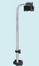
Darbo vieta kabelių pakaba nuoroda. 052284