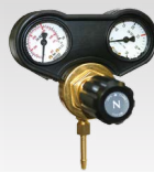
Regulators 30 l/min 041622 041219 041646