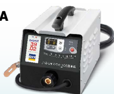
PROLINER 39.02 - ref. 035775 PROLINER 39.04 - ref. 035782