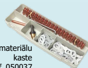
Tērauda palīgmateriālu kaste ref. 050037