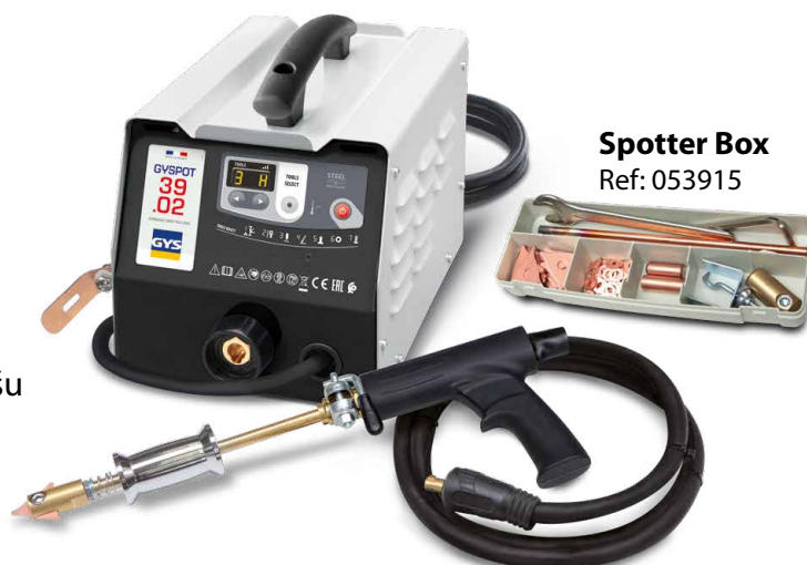
Spotter Box Ref: 053915

Metināšana tiek aktivizēta automātiski ar vienkāršu kontaktu starp instrumentu un taisnojamo daļu.