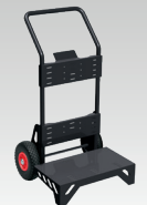
Steekwagen JOB SITE XL 039568