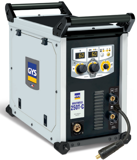
Geleverd zonder accessoires (014572)