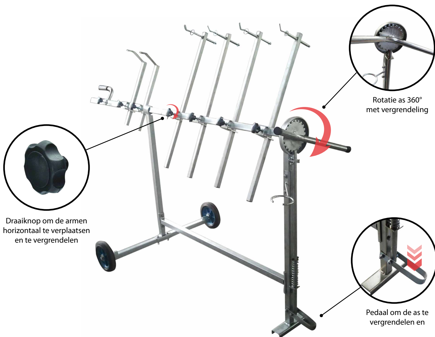
Draaiknop om de armen horizontaal te verplaatsen en te vergrendelen