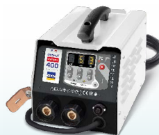
PROLINER PRO 230 - ref. 035799 PROLINER PRO 400 - ref. 035805