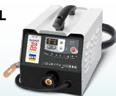
PROLINER 39.02 - ref. 035775 PROLINER 39.04 - ref. 035782