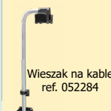
Wieszak na kable ref. 052284