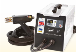
PROLINER ALU PRO FV - ref. 035836