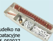
Stalowe pudełko na materiały eksploatacyjne ref. 050037