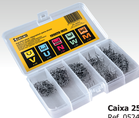
Caixa 250 grampos Ref. 052413