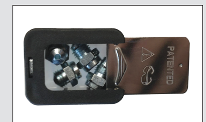
Compartimento de armazenamento para extremidades