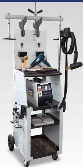
Proliner alu PRO FV