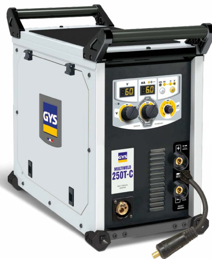
Dodáva sa bez príslušenstva (014572)