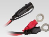
Konektor s očkom 45 cm - M6 029194