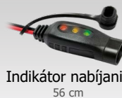
Indikátor nabíjania 56 cm