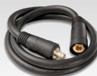
Kábel na prepájanie 033689