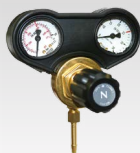
Regulátor 30 l/min 041622 041219 041646