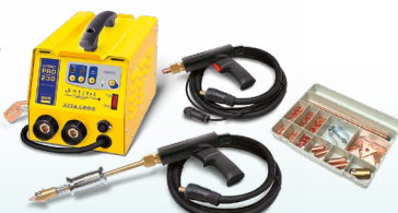
SPEEDLINER PRO 230 - ref. 036017 SPEEDLINER PRO 400 - ref. 036024