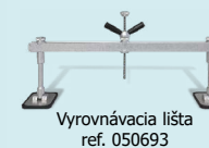
Vyrovnávací lišta ref. 050693