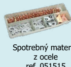
Spotrebný materiál z ocele ref. 051515