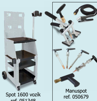
Spot 1600 vozík ref. 051348