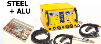
SPEEDLINER Combi 230 E PRO - ref. 036062