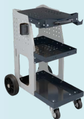
Spot 800 vagn ref. 051331