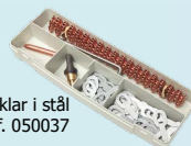
Förbrukningsartiklar i stål ref. 050037