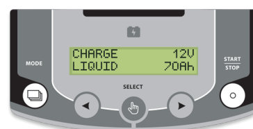
Intuitives Bedienfeld in 22 Sprachen