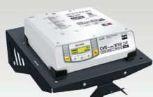
Ράφι τοίχου 055513