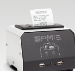
SPM : Μονάδα εκτυπωτή 026919