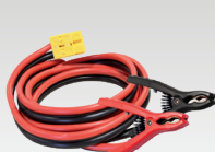
8 m - 16 mm 2 056572