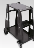
Καροτσάκι PLASMA 600 040298