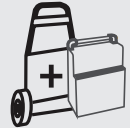
Carro 31 x 55 x 93 cm 45,5 kg