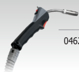
Antorcha Push Pull