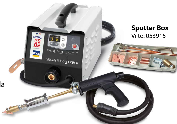
Spotter Box Viite: 053915

Hitsaus käynnistyy automaattisesti yksinkertaisella kosketuksella työkalun ja oikaisuosan välillä.