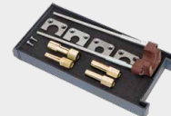
Tarvikelaatikko arcpull 700 : Ile 068322