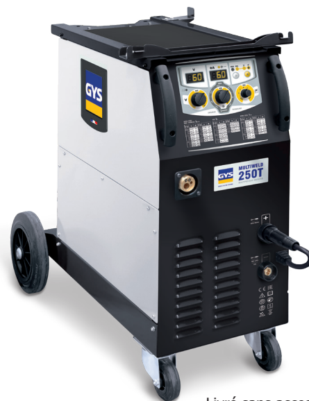
Livré sans accessoires (031678)