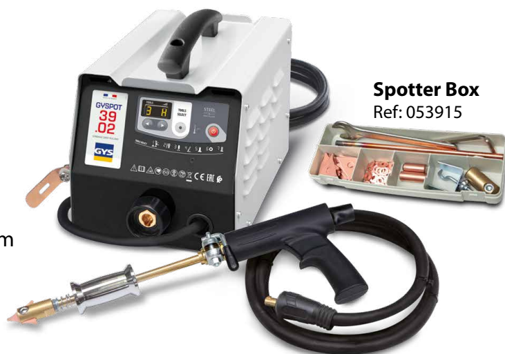
Spotter Box Ref: 053915

Zavarivanje se pokreće automatski jednostavnim kontaktom između alata i dijela koji se ravna.